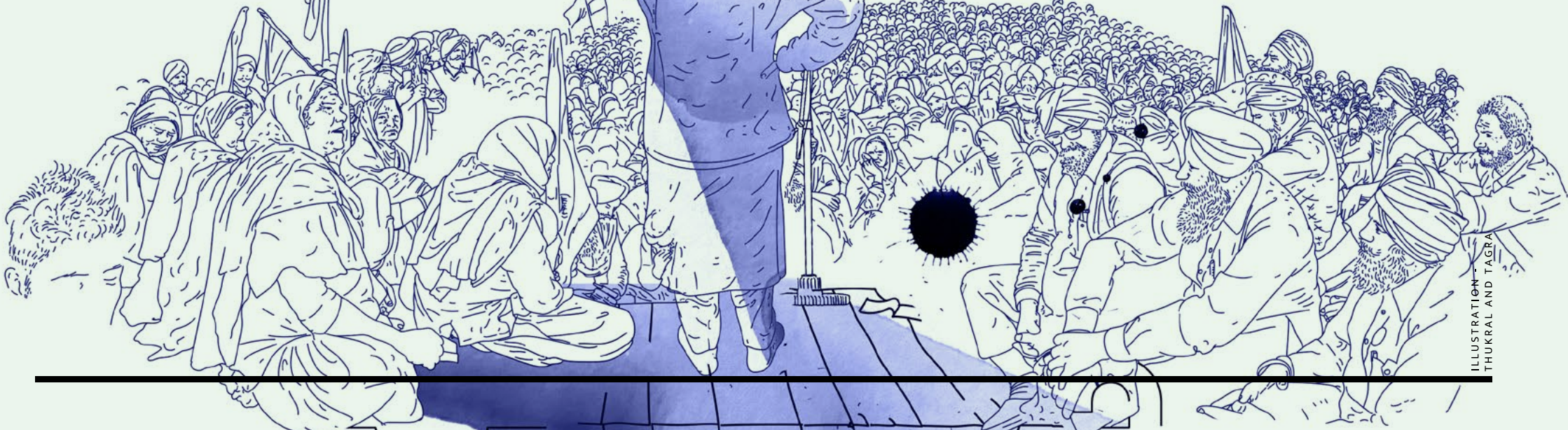
ILLUSTRATION - TAJRA